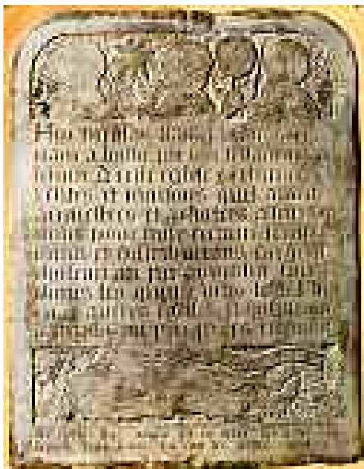
ÉPITAPHE DE NICOLAS FLAMEL.

tombeau et lui promet : « et après toi, tous les peuples de l'une à l'autre mer y viendront en pèlerinage... Ils y viendront depuis le temps de ta vie jusqu'à la fin des temps. » Elles le sont très longuement dans le Veneranda dies , long sermon inclus dans le Livre I du Codex Calixtinus :