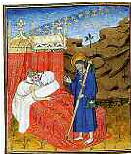
SONGE DE CHARLEMAGNE, GRANDES CHRONIQUES DE SAINT-DENIS, FIN DU XV e SIÈCLE.

Le tombeau d'un apôtre ne pouvait manquer d'attirer les visiteurs qui pouvaient effectuer le voyage. Celui de saint Jacques devait d'abord être défendu et Compostelle était à la tête de la reconquête de l'Espagne sur les Sarrasins. Les premiers pèlerins furent les chevaliers, à la suite de Charlemagne. Vrais ou faux, réels ou imaginaires, d'autres après eux ont fréquenté les routes de Compostelle : ceux du Moyen Âge vivent leur dévotion en même temps qu'ils guerroient, commercent ou s'amuse, ceux du XVI e siècle sont plus concentrés sur la démarche pénitentielle, pénétrés déjà des canons du Concile de