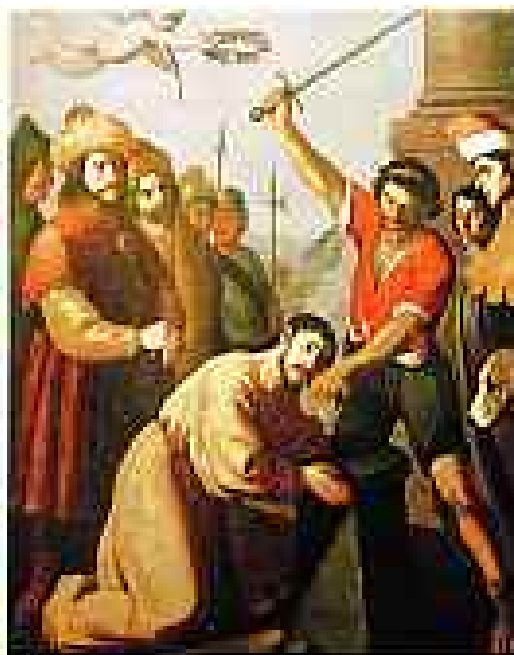
FRANCISCO DE ZURBARÁN, MARTYRE DE SAINT-JACQUES Musée du Prado, Madrid.

« [...] ces pèlerins, qui ont coutume de venir en grand nombre chaque année visiter les sanctuaires de l'Espagne, qu'ils regardent comme