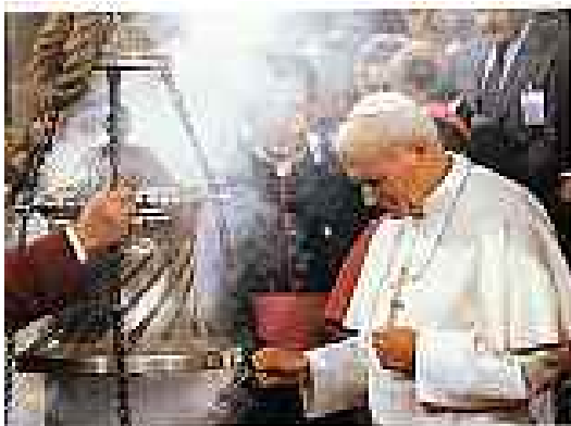
JEAN-PAUL II À COMPOSTELLE EN 1989, À L'OCCASION DES JMJ.

En 1836, le journal Le Magasin pittoresque avait déjà souligné la « dimension civilisatrice des pèlerinages » en écrivant : « Qui pourrait estimer tout ce que les pèlerinages ont transmis de civilisation orientale à l'Europe ? » Charles Pichon pendant la guerre avait envi-