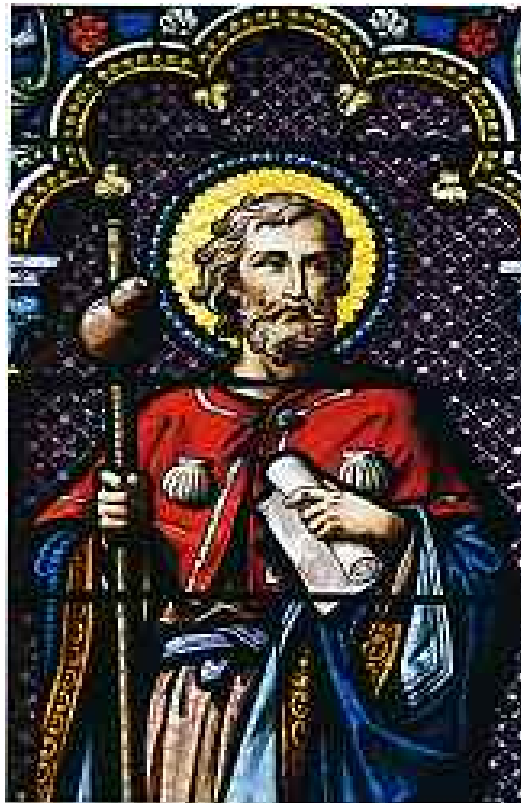
VITRAIL REPRÉSENTANT SAINT-JACQUES EN L'ÉGLISE DE CORNILLE-LES CAVES, XIX e SIÈCLE.

d'autrefois vers l'Espagne ! » mais se réjouit de la solution de remplacement qui lui tombe du ciel : « attirer Compostelle parmi nous, pour y relever le culte du grand apôtre ». Il vient de recevoir de l'évêque de Chartres une relique de saint Jacques présentée sur la poitrine d'un corps en cire de l'apôtre, réduit aux deux tiers et couché dans un cercueil de verre. En 1875 à Locquirec, c'est une relique du « sang de saint Jacques » qui est authentifiée par Rome.