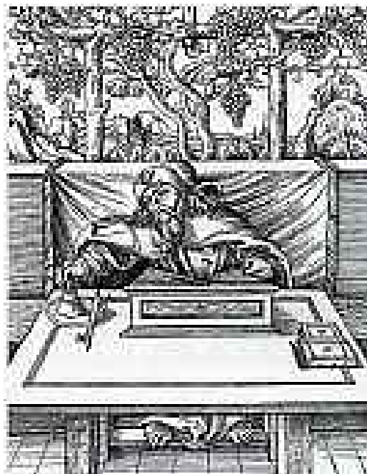
LUCAS CRANACH LE VIEUX, SAINT- JACQUES.