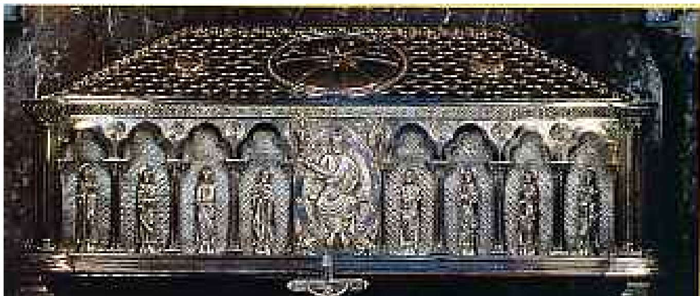
LE TOMBEAU DE SAINT-JACQUES.

En 1879, l'archevêque de Compostelle entreprend des fouilles. Il découvre des restes humains, rapidement identifiés comme ceux de l'apôtre et de ses compagnons. Les précieuses reliques prétendument disparues en 1589 sont retrouvées. Le Vatican est aussitôt saisi pour une reconnaissance officielle. Après s'être entouré des précautions d'usage et avoir consulté le Sacré Collège, le pape Léon XIII publie en 1884 la Lettre Apostolique ou Bulle Deus Omnipotens . Il y répond par l'affirmative à la question : « [...] la sentence portée par le Cardinal archevêque de Compostelle sur l'identité des reliques [...] qu'on dit être de saint Jacques le Majeur apôtre et de ses disciples Athanase et Théodore, doit-elle être confirmée dans le cas et pour le but dont il s'agit ? ». La rédaction ambiguë de cette Bulle incite assez peu les évêques à envoyer des pèlerins à Compostelle. Certes, le pape demande que soient à nouveau entrepris « les pieux pèlerinages à ce saint tombeau, comme nos ancêtres